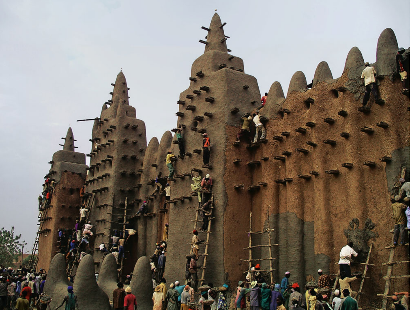
Renovierungsritual an der Lehm moschee von Djenné (Mali): Mischung aus Zauberschloss und Termitenhügel