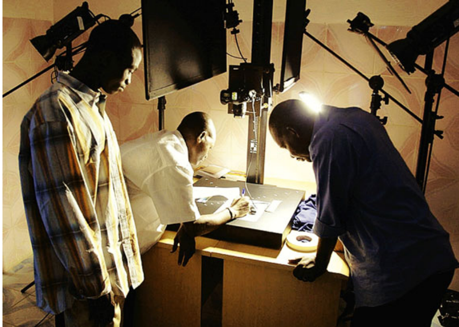
HERMAN WALLACH / NUMAPS