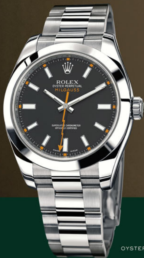
OYSTER PERPETUAL MILGAUSS