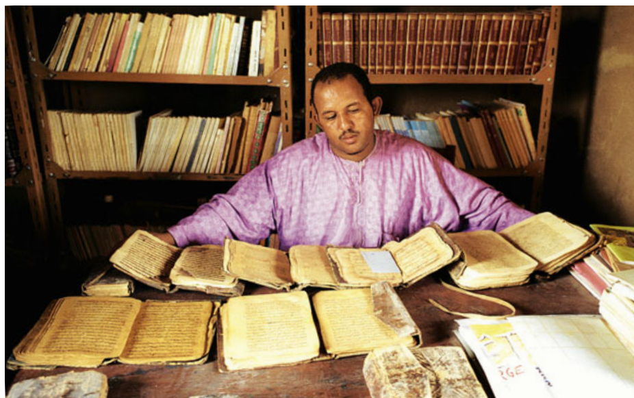
Privatbibliothek bei Timbuktu: Wiederentdeckung des schwarzen Oxford